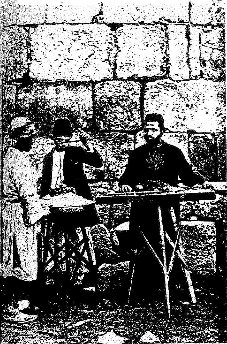
ממראות ירושלים בעת הופעת "עמוד היראה" — רוכלים יהודים ומרכולתם

בתרליג פרסם את תוכניתו הכוללת למדינה יהודית, ליישוב הארץ ולפיתוחה. בין השאר נכנס לפרטי פרטים בנושאי הביטחון והעלייה, דברים שאיש לא העז לכתוב עליהם באותם ימים — ועורר עליו את זעמם של ממוני ה"כוללים", שראו בתוכנית סכנה מוחשית לשיטת ה"חלוקה". בינתיים פירסם את ספרו "בית יוסף חדש", ופסק הלכה שכלל בו, שהתיר לעבור על חרם דרבנו גרושום האוסר ריבוי נשים במקרה של אשה הממאנת ללכת אחר בעלה